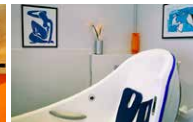
▲ Salle de balnéothérapie

Un chemin de ronde, agrémenté de nombreux bancs, permet une promenade agréable et accessible aux personnes à mobilité réduite dans le parc du château.